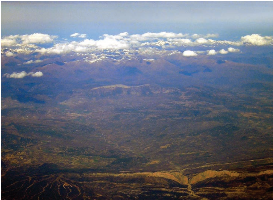
Figura 2. Vista general de la Terreta, de sud-sud-oest cap a nord-nord-est, i des d'una altura aproximada de 5.000 m

La imatge permet apreciar bé la seva ubicació dins el sector oriental de la Ribagorça, en el sector mitjà de la vall de la Noguera Ribagorçana. Aquest riu, que discorre en diagonal per la banda esquerra de la foto, queda perfectament enquadrat entre el congost de Mont-rebei, en primer terme, que talla netament l'anticlinal del Montsec, i el congost d'Escales, a l'extrem oest de la Serra de Sant Gervàs, una mica per damunt del centre de la imatge. A darrer terme, les carenes nevades del Pirineu axial, des del límit Val d'Aran-Alta Ribagorça (esquerra de la imatge) fins al límit Pallars Sobirà-Andorra-Alt Urgell. Amb aquesta fotografia com a referència, val la pena fer notar l'anomalia fronterera del curs de la Noguera Ribagorçana: riu que separa políticament dos territoris (Catalunya i Aragó) que en aquest sector conformen una unitat natural i geogràfica evident i inapel·lable. [Fotografia de Valerià Paül, tardor de 2008].